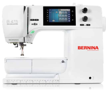
BERNINA 475 QE